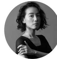
篠原ともえ デザイナー/アーティスト