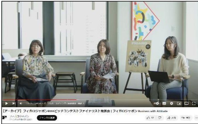
ピッチコンテスト内での基調講演 想定参加者：200-300人

7月18日に開催されるBWAピッチコンテスト内のBWAとコラボレーションした基調講演を実施。 また、開催された基調講演に関しては、事後記事のみでなく再編集して動画広告として広告配信することで一定リーチも可能です。