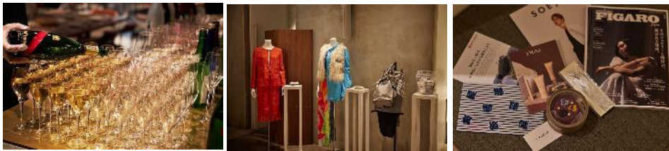
会場での商品・サービスの展示や来場者へのサンプリング、受賞者へのプレイズメントが可能。