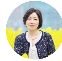
浜田敬子 ジャーナリスト