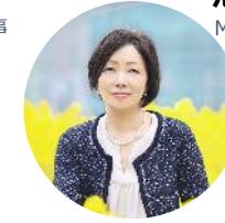
浜田敬子 ジャーナリスト